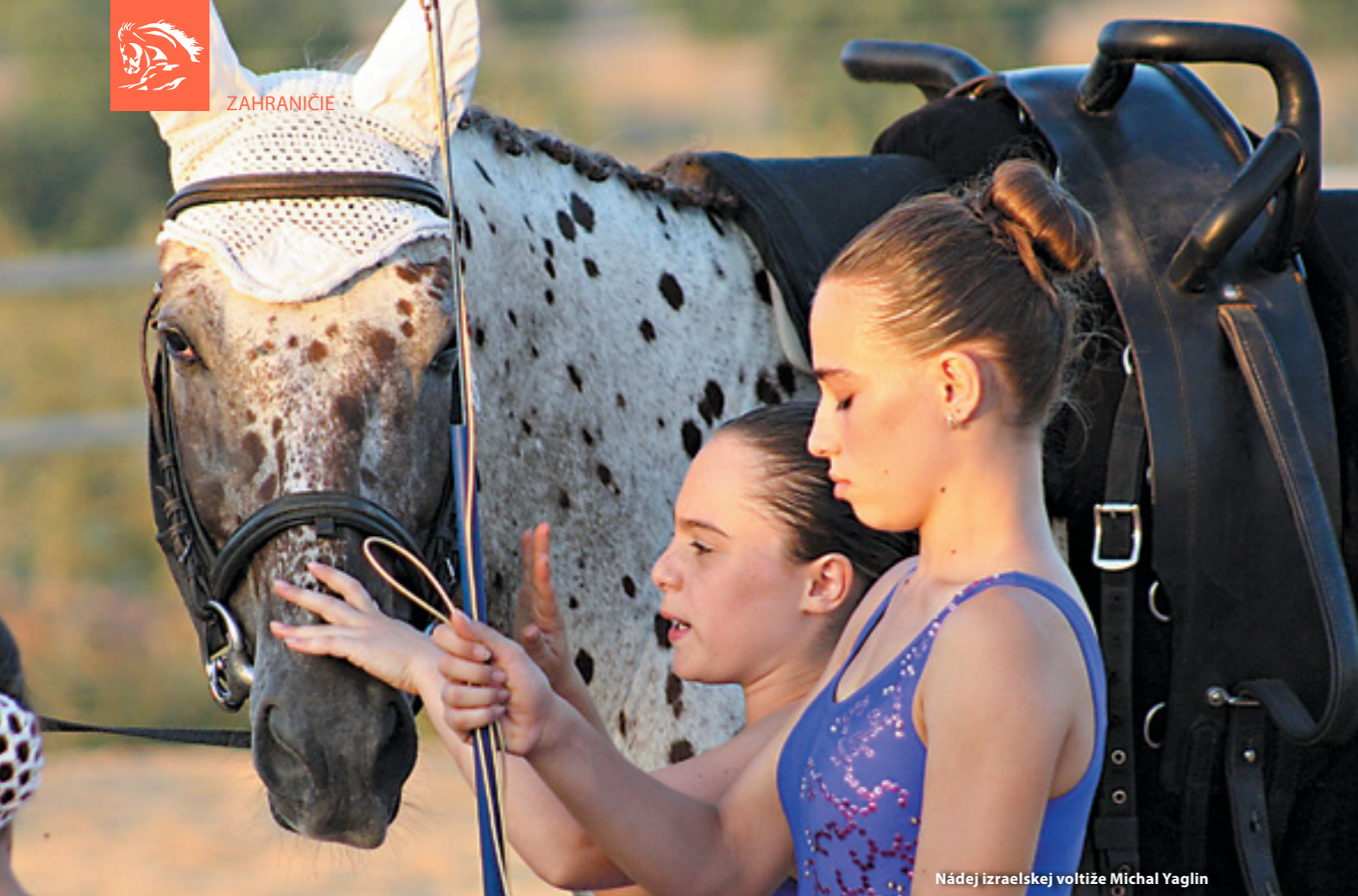
Nádej izraelskej voltíže Michal Yaglin