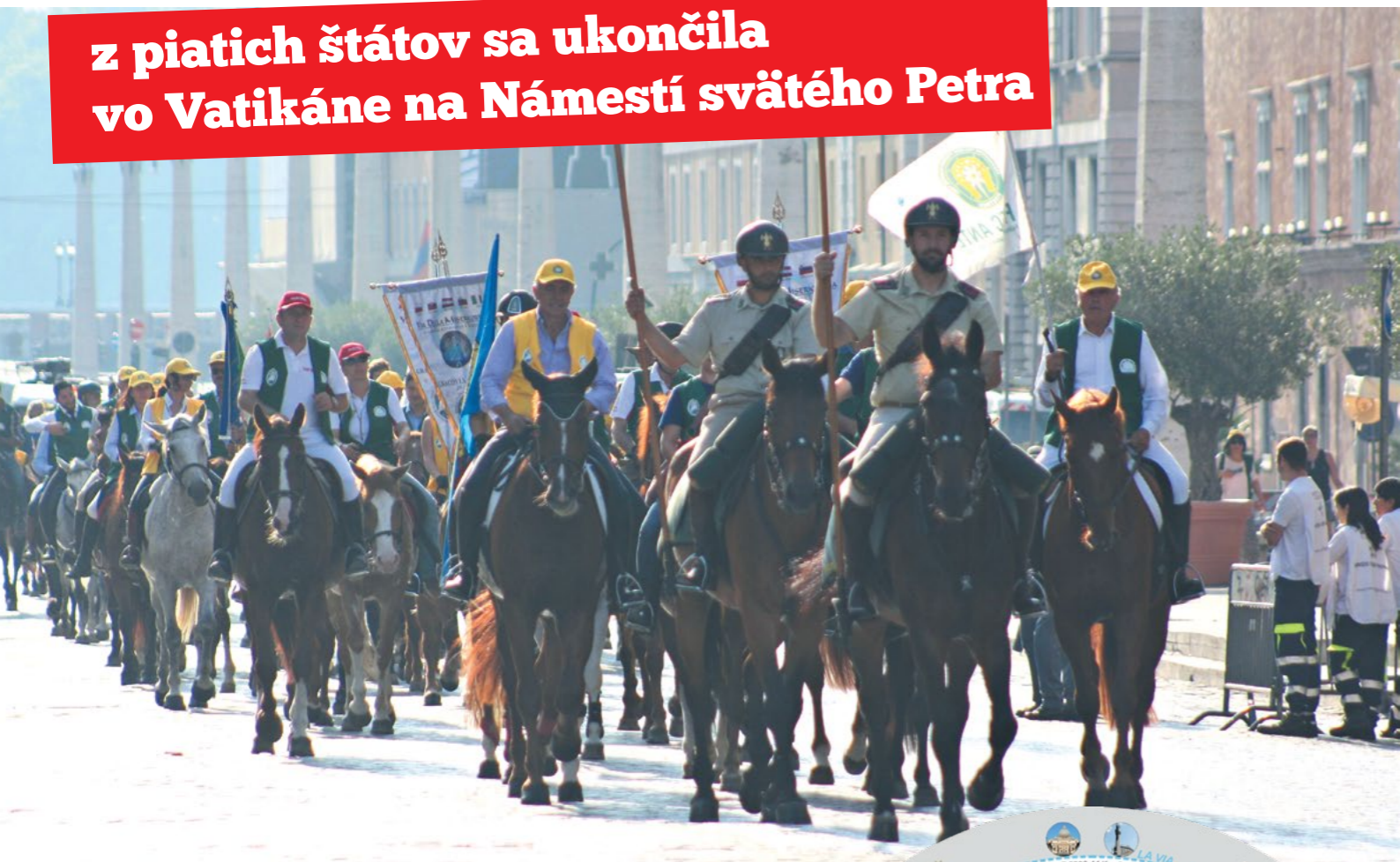
Pred Námestím sv. Petra

z piatich štátov sa ukončila vo Vatikáne na Námestí svätého Petra