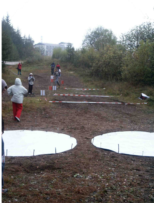
Príklad plnenia kontroly HOD NA

V prípade hodov z kratšej vzdialenosti, ako je vzdialenosť prislúchajúca mu podľa kategórie, sú jeho hody považované za neplatné. V prípade hodov zo vzdialenosti väčšej, ako je vzdialenosť prislúchajúca mu podľa kategórie, sú jeho hody považované za platné.