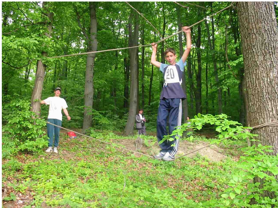
Príklad plnenia kontroly LANOVÁ LAVIČKA