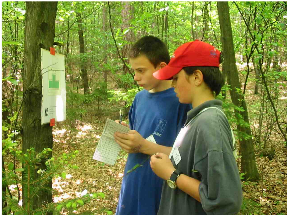
Príklad plnenia kontroly TT